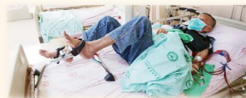
床上運動腳踏車治療