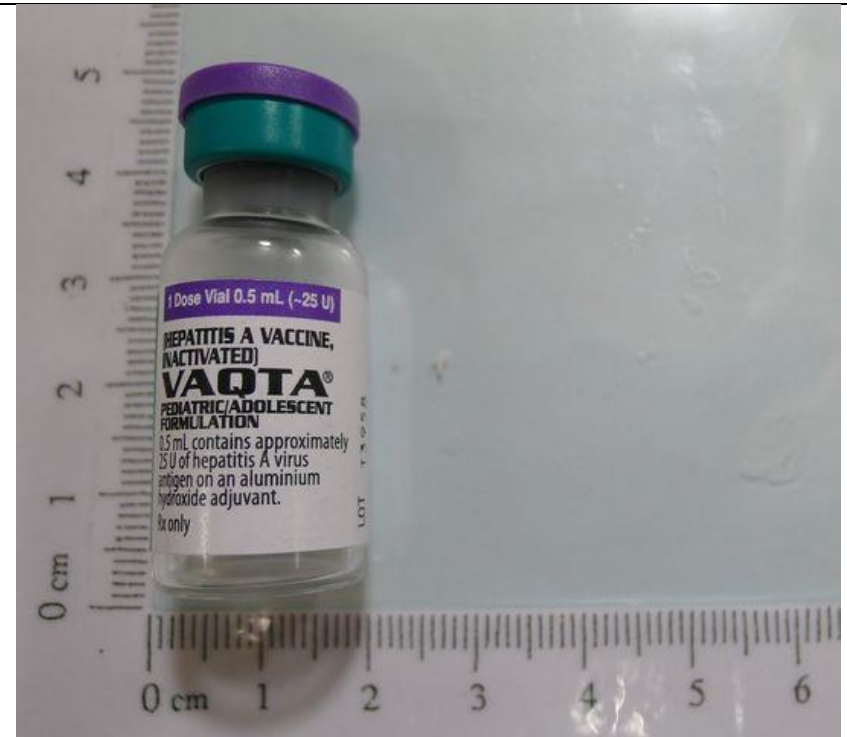
Hepatitis A Vaccine 25U/0.5mL/Vial Vaqta 25U/0.5mL/Vial "唯德"不活化 A 型肝炎疫苗 25U/0.