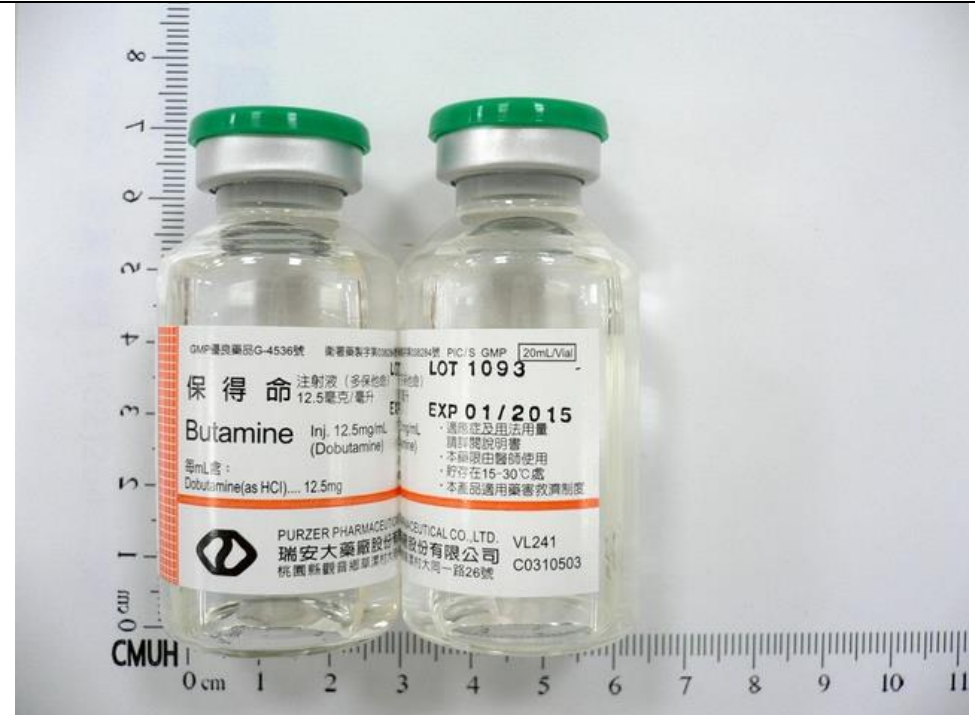
DoButamine 12.5mg/ml 20ml/VI 保得命注射液 Butamine 12.5mg/ml 20ml/VI