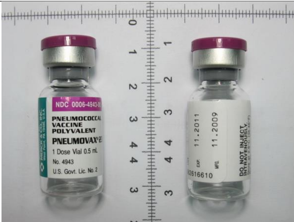
Pneumococcal 疫苗 23 價肺炎鏈球菌疫苗