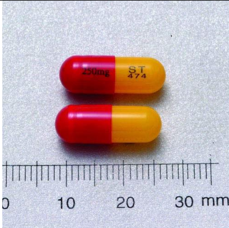
Amoxicillin 250mg/Cap 安謀黴素膠囊 250 毫克