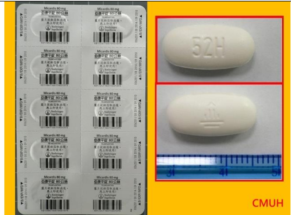
TelmiSartan 80mg/T MiCardis 80mg/T 必康平錠