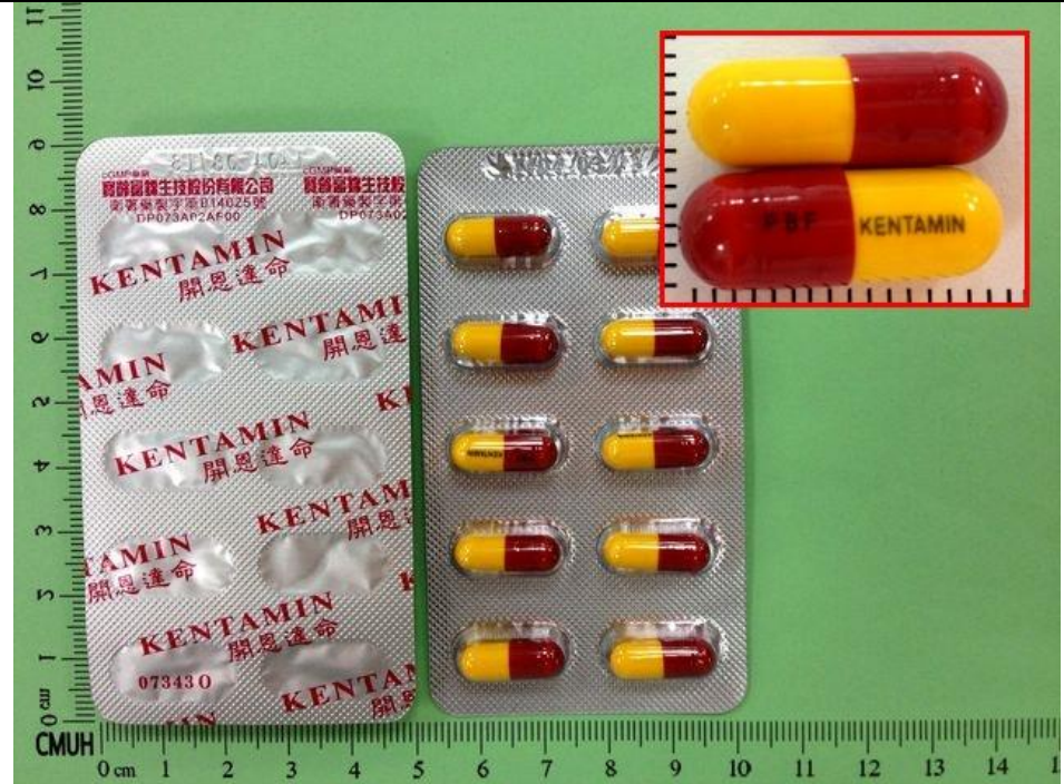
Kentamin Cap(複方) 開恩達命膠囊