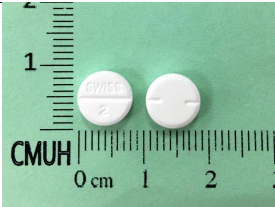
Trihexyphenidyl 2mg/Tab 瑞丹錠 Switane®