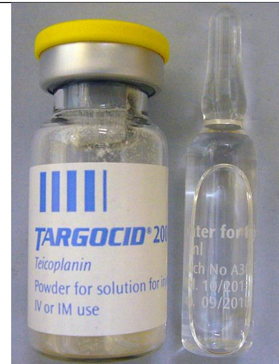
Teicoplanin 200mg/Vial 得時高凍晶注射劑 Targocid®