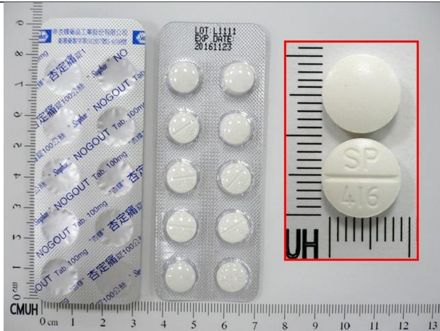
Benzbromarone 100mg/Tab 杏定痛錠 Nogout®