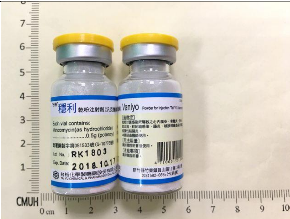
Vancomycin 500mg/Vial 穩利乾粉注射液 Vanlyo®