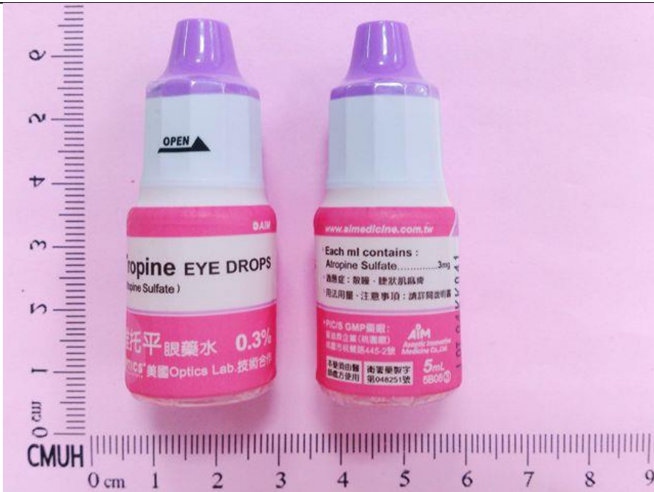
Atropine EYE drops 0.3% 5mL/Bot 雅托平眼藥水 Tropine®