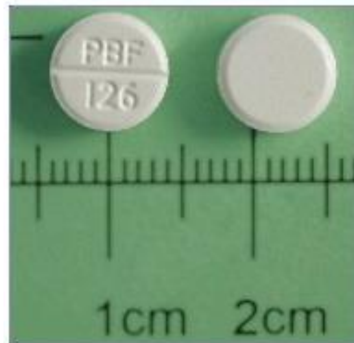
Zinc Gluconate 78mg/Tab 鋅寶錠 Zinga®