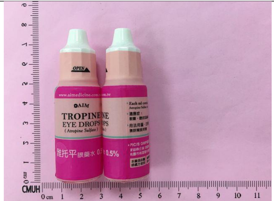
Atropine 0.5% eye drops 10mL/Bot 雅托平眼藥水 Tropine®