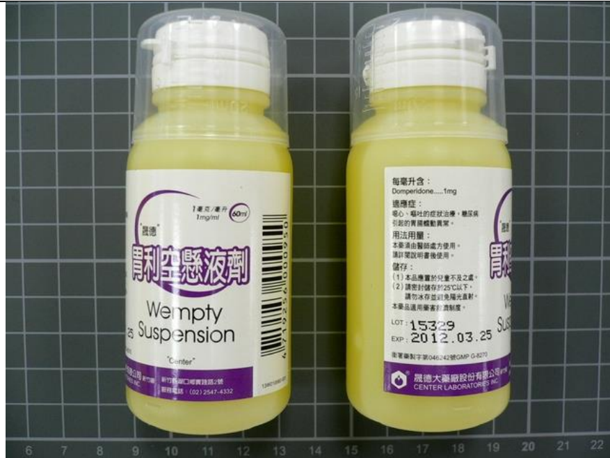
Domperidone 1mg/mL 60mL/BT 胃利空懸液劑 Wempty®