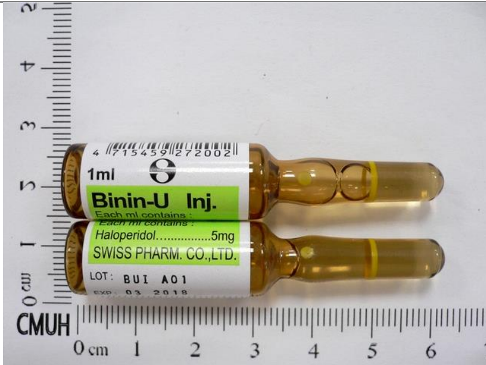
Haloperidol 5mg/mL/Amp(綠標) 易寧優注射液 Binin-U®