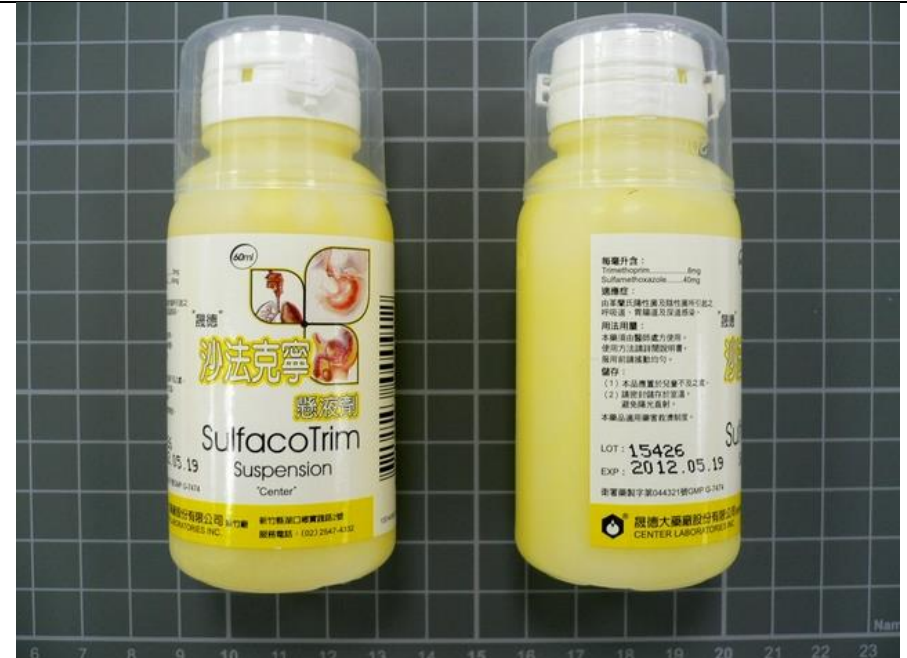
Sulfacotrim susp 60 ml/BT 沙法克寧懸液劑