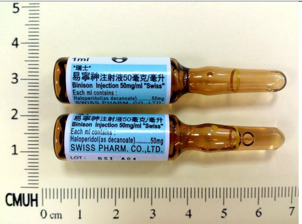
HALOperidol 五十 mg/mL/Amp(藍標) 易寧神注射液 Binison®